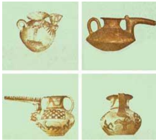
نمونه هایی از آثار سفالین تپه سیلک کاشان که قبل از ورود آریایی ها ساخته شده است .